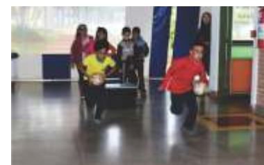
Muita brincadeira no DIA DAS CRIANÇAS!