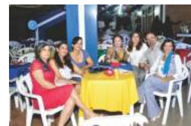
... e pose para foto!!!