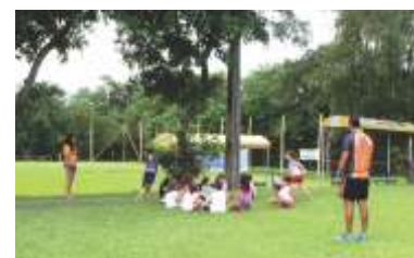
Colônia de Férias da AABB ! A criançada adorou!