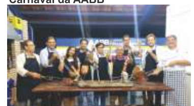
Curso de Técnicas de Churrasqueiro!