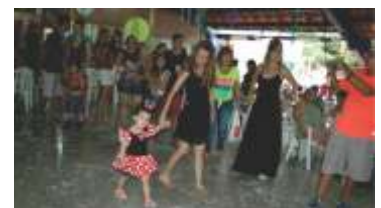
Desfiles de fantasia na Matiné de Carnaval da AABB