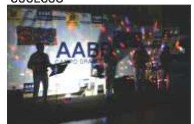
Salão lotado na Noite Tropical