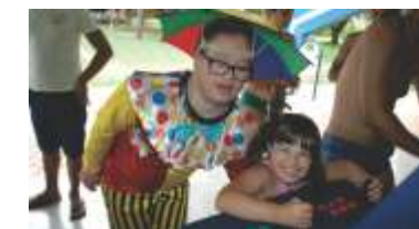
Matiné da AABB