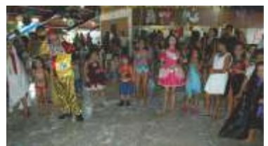
A criançada adorou nossa Matiné!