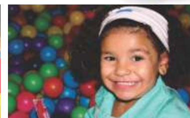
Um sorriso muda o mundo!