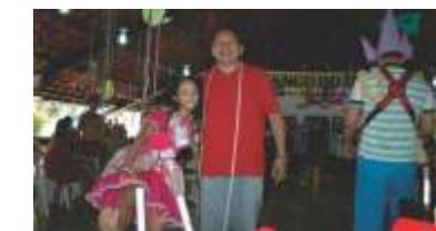
Matiné da AABB