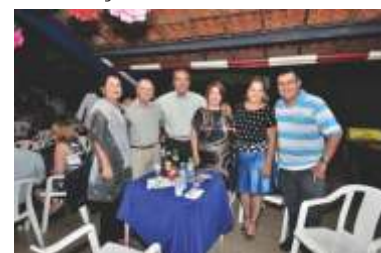
A Noite do Flash Back foi um SUCESSO