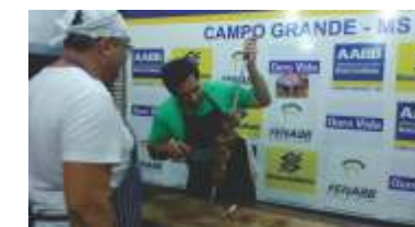
Essa picanha tava boa demais!!!