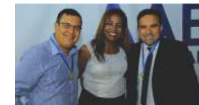
Evento PERSONALIDADE NOTA 10