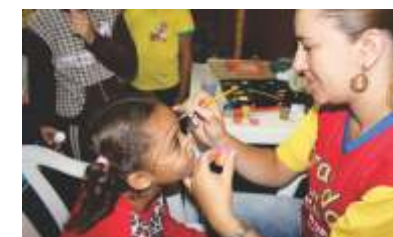
Gincana e pintura para todos!