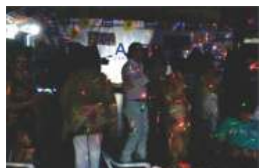
Pessoal animado na pista de dança