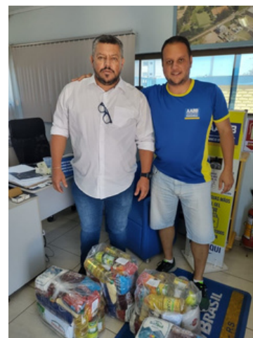
Secretários Municipais Doação de 04 Cestas Básicas