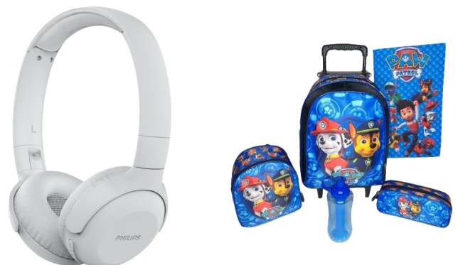
18º PRÊMIOS SORTEADO - 02 kit Mochila Escolar Patrulha Canina e 01 Fone de Ouvido Philips com Bluetooth, Wireless e Microfone.