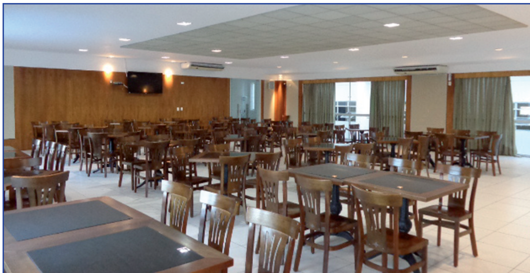
Salão Cristal comporta até 160 pessoas sentadas e está ganhando cozinha e banheiros exclusivos

tigo (tem cerca de 10 anos), também se integra muito bem a qualquer tipo de reunião. Tem espaço para 25 mesas e 100 cadeiras. Fica ao lado do Cristal.