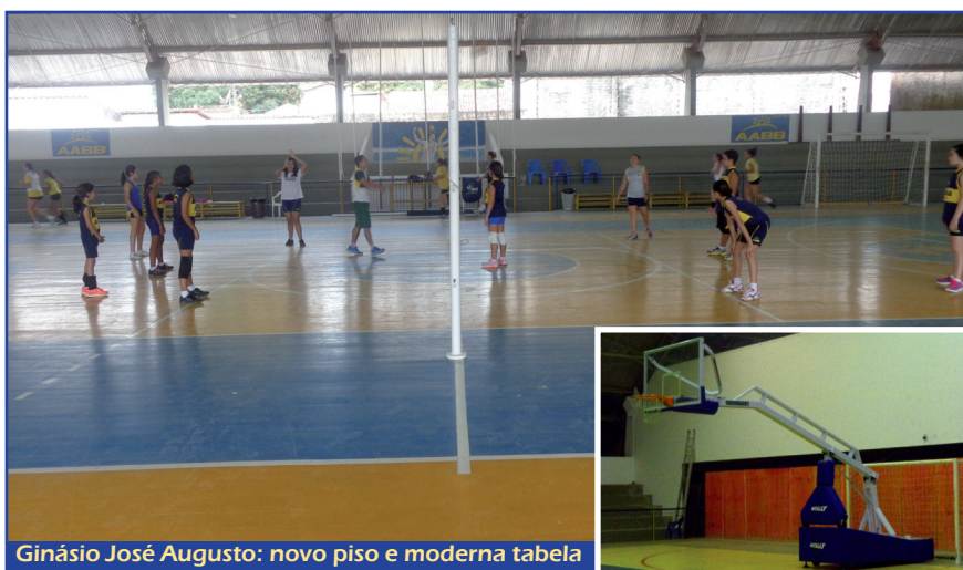
Ginásio José Augusto: novo piso e moderna tabela

A dinâmica esportiva da AABB Natal segue tendências mundiais, com práticas saudáveis e de resultado comprovado. Os aulas são um exemplo. Trata-se de aulas de treinamento funcional ao ar livre, que cada vez mais reúne novos adeptos e atletas já experientes.