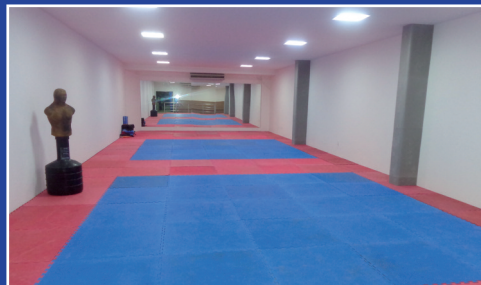
Dojô ABB foi inaugurado recentemente