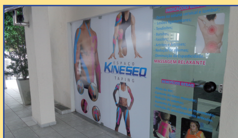
Mais um serviço para o bem estar

Outra novidade recente da AABB Natal no item bem estar (wellness) diz respeito ao Espaço Kinesio Taping, indicado para dores na coluna cervical e lombar, lesões de ligamentos, tendinites, bursites, artrites e artroses. Os benefícios também remetem ao controle do tônus muscular, redução de edemas, aumento da amplitude de movimentos e correção do posicionamento.