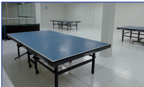
Mesatenistas têm espaço exclusivo

Para os adeptos do tênis de mesa e da sinuca, há novos locais específicos, amplos e climatizados. Há mesas novas e reformadas, com novo pano, no caso da sinuca, onde sempre há torneios internos. Vale lembrar que o clube participa de várias competições pelo Brasil na modalidade. Já o espaço dos mesatenistas é uma novidade. Pela primeira vez, a AABB Natal ganha uma sala exclusiva para eles.