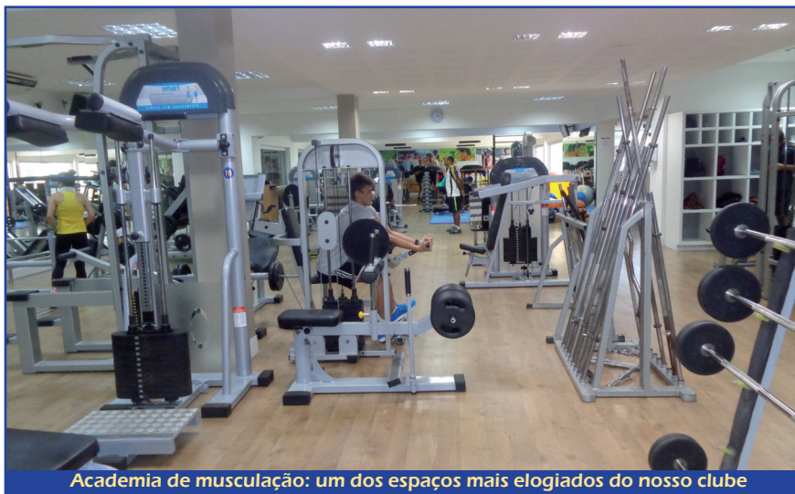
Academia de musculação: um dos espaços mais elogiados do nosso clube