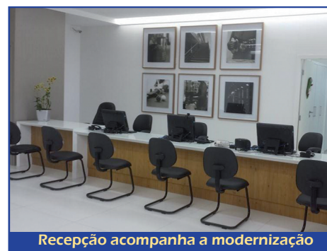
Recepção acompanha a modernização