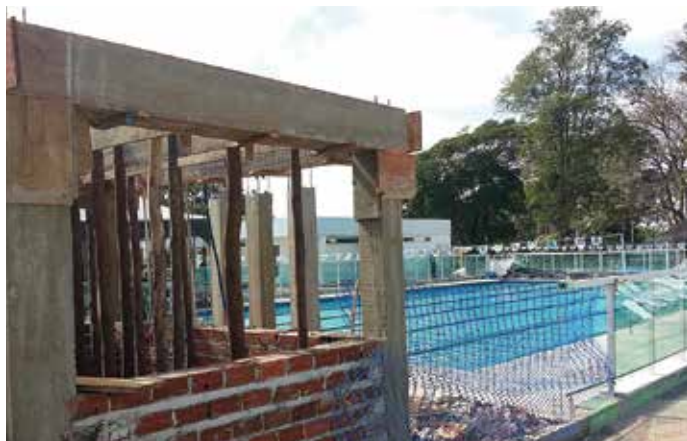
NOVA ENTRADA DA PISCINA! Após a instalação do blindex na piscina de 25 metros, obras da nova portaria estão bem adiantadas

Presidente do Minas Brasília Tênis Clube