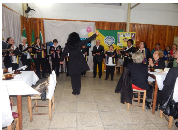
Coral AABB-Casa do Poeta no SIMCA, em 14.09.2016