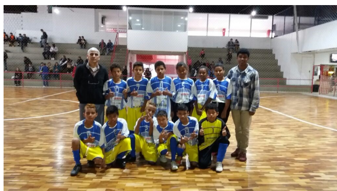
Crianças da Escolinha de Futsal Tio Dívio