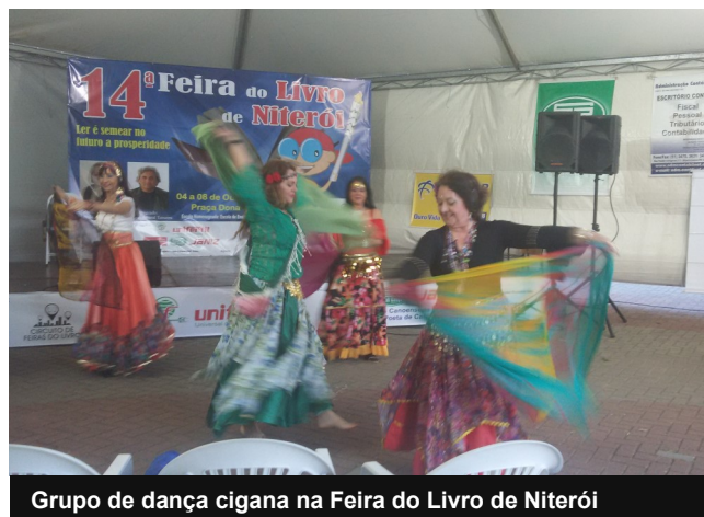
Grupo de dança cigana na Feira do Livro de Niterói

Interessados em participar do Grupo podem obter mais informações pelo telefone (51) 3922.3540.