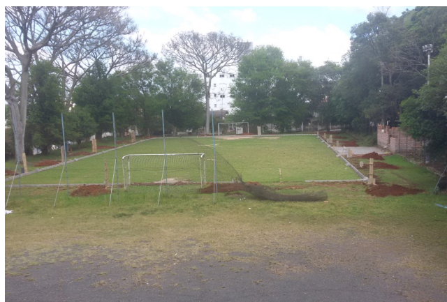
Campo de futebol society da AABB Canoas em obras

A parceria é baseada no conceito de mercado chamado "relação ganha x ganha", onde todas as partes saem ganhando: AABB: pela maior movimentação de pessoas; investidor: pela exploração comercial do campo; associados e atletas da comunidade canoense: porque passam a contar com um espaço esportivo de maior disponibilidade durante todo o ano.