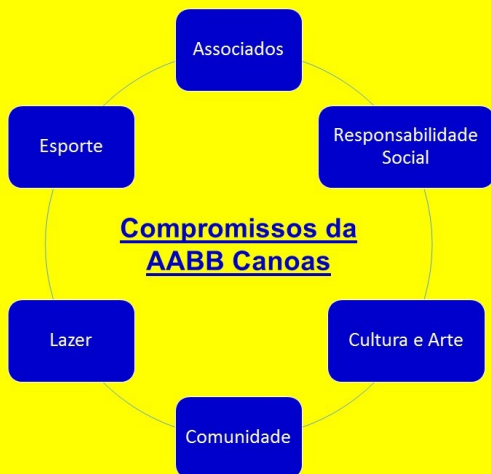
Mapa de compromissos da AABB Canoas

Venha para a verdadeira rede social. A AABB espera por você!