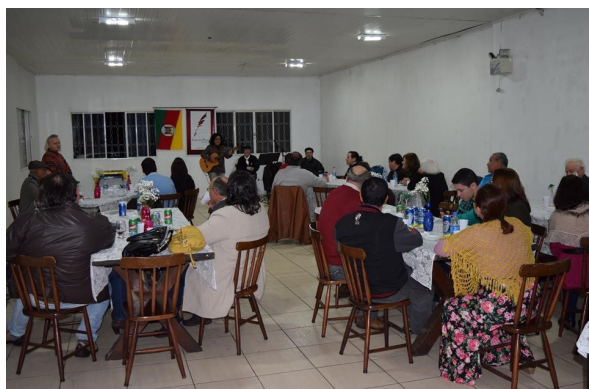
Jantar do DTG da Casa do Poeta, de 15.07.2016

Você também pode participar. É só comparecer.