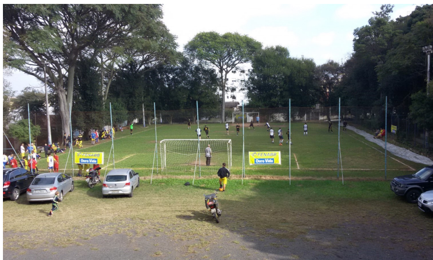
Quadra de futebol da AABB Canoas

Venha para a verdadeira rede social. A AABB espera por você!