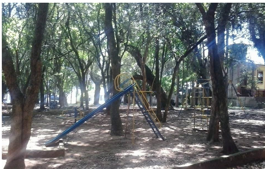
Parque infantil da AABB Canoas