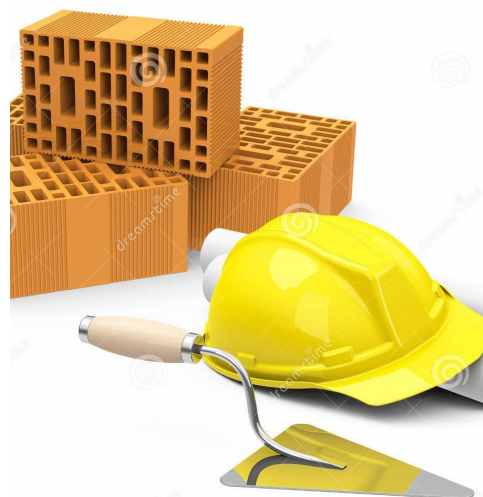
AABB Canoas em Obras

Venha para a AABB Canoas, a verdadeira rede social!