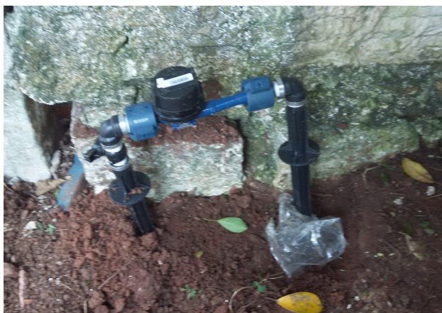
Instalação de água da Corsan na Rua Pedro A. Cabral