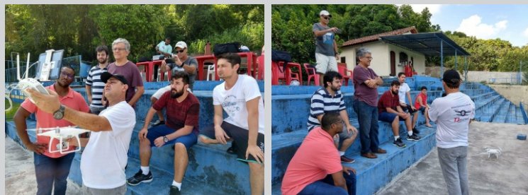
A primeira turma foi sucesso absoluto.

Inscrições abertas para o curso, turmas reduzidas. Dias 17 e 18 de fevereiro e Dias 24 e 25 de fevereiro na AABB PIRATININGA.