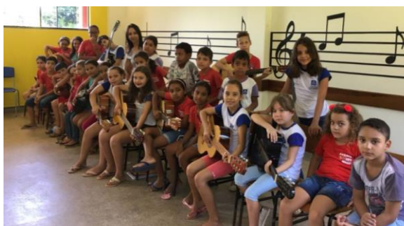
Alunos atendidos pelo programa.

A Escola em Colíder atende cerca de 106 alunos participantes do projeto, distribuídos nos períodos matutino e vespertino. Diante da grande participação dos alunos, a escola estava com poucos instrumentos musicais para atender a demanda.