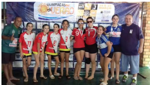
Entrega das premiações.

Nos dias 24 e 25 de março aconteceram as Olimpíadas de Verão 2018 na AABB de Colíder. O evento esportivo foi realizado pela Secretaria de Esportes do município, com o apoio da AABB, Prefeitura Municipal e acadêmicos da Facider.