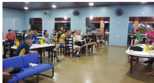
Associados acompanhando o sorteio.

O sorteio dos atletas para composição dos times do Inter-sócios 2018 “Copa do Mundo” foi realizado no dia 15 de março na sede da AABB. Mais de 40 pessoas estavam presentes acompanhando o sorteio e aguardando para conhecer em primeira mão o elenco dos times deste ano.