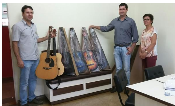
Entrega dos instrumentos arrecadados.

Mais de 170 escolas em 59 municípios participam do projeto, dentre elas está a Escola Estadual André Maggi localizada em Colíder-MT.