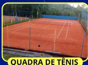
QUADRA DE TÊNIS