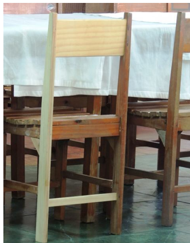
Com jeito vai

O sistema utilizado para controle de entradas de associados na sede prevê o cadastramento de nome e fotografia. Daí que os associados devem atualizar as informações, principalmente a foto, que é feita na hora, sem custo.