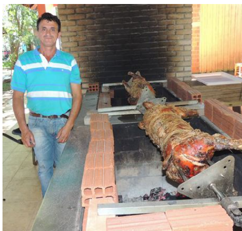
Neno, em 2014

A Festa Nacional do Porco Assado no Rolete, no Clube de Caça e Pesca, será no dia 20 de setembro. Os visitantes avulsos, que não participam de um estande, terão a opção do bifê – o preço será de R$ 30,00. No mesmo dia da festa e repetindo o ano anterior, os Veteranos da AABB receberão os de Dez de Maio para o jogo da agenda e servirão um almoço especial: porco assado no rolete e costelão. O evento é basicamente para os atletas e torcedores assíduos – mas será acrescido alguns convites para pessoas ligadas aos veteranos. O preço do ingresso, sem subsídio, será de R$ 25,00.