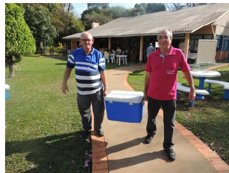
Pavan e Esltor, saindo para a pescaria