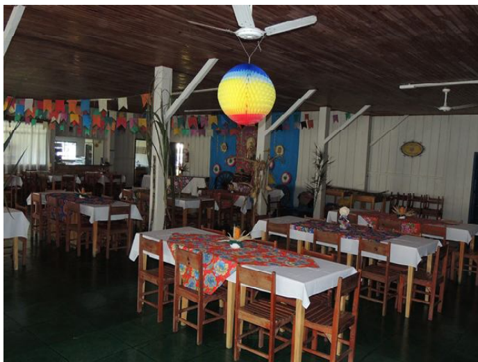
Visão parcial do salão, antes da festa