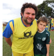
Filho apoia o pai