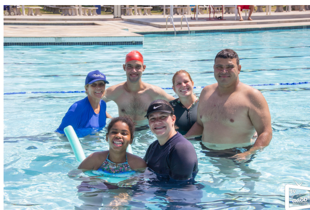
Alunos da Apabb