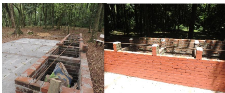
Mais churrasqueiras no matinho