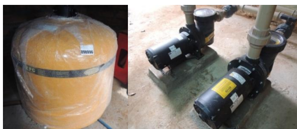
Novos sistemas de motores para piscina e Revitalização dos bancos de fibra