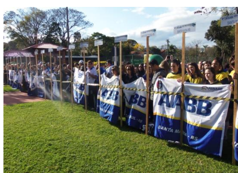
Delegações preparadas para Abertura