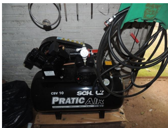
Compressor, pistola pintura, mangueira hidro/ar.