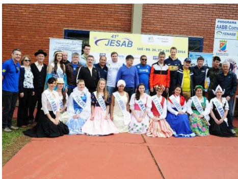
Autoridades na cerimônia de Abertura