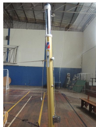
Novos postes vôlei (profissional)