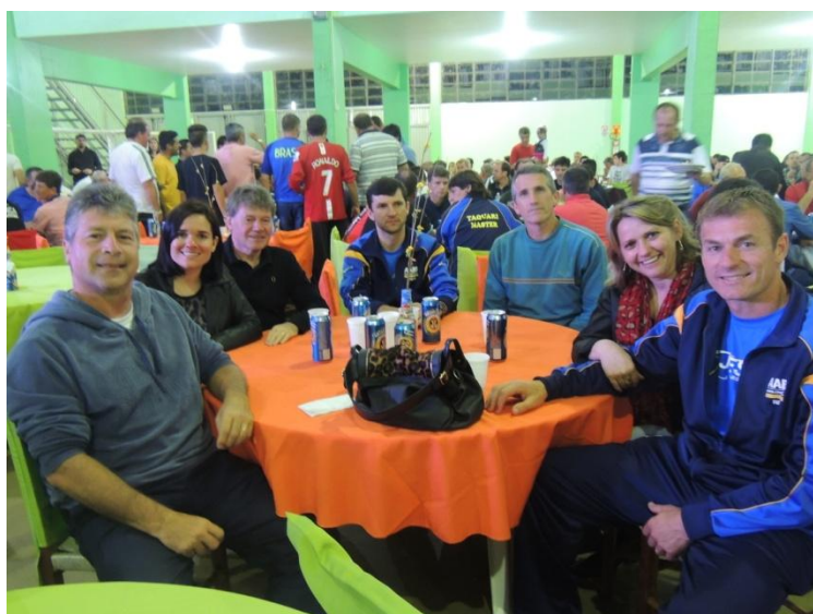
CONFRATERNIZAÇÃO SÁBADO A NOITE