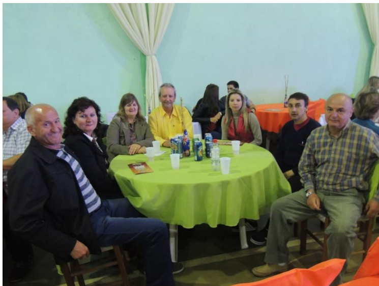
CONFRATERNIZAÇÃO SÁBADO A NOITE