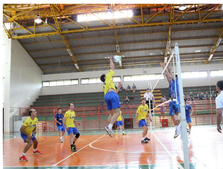
Disputa AAB Santa Cruz e AAB POA