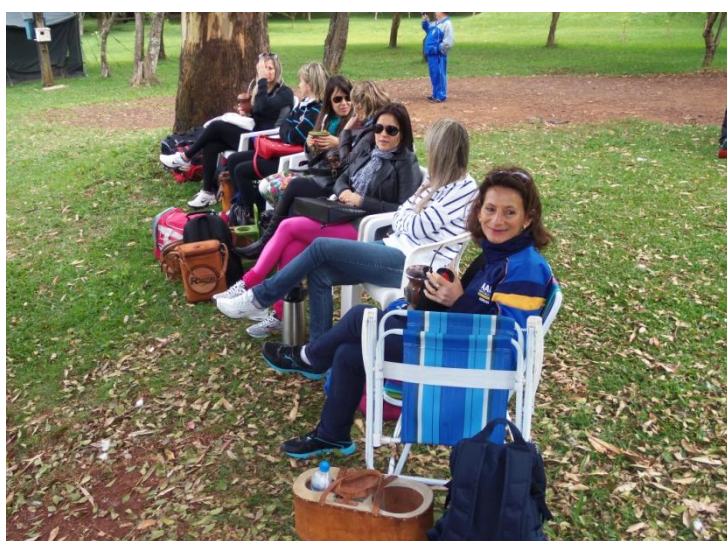
Torcida sempre presente!