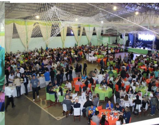
CONFRATERNIZAÇÃO SÁBADO A NOITE