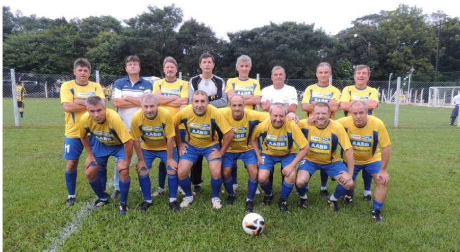
Futebol Minicampo Supermaster (50 anos)