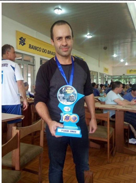
Campeão - Sinuca

Defesa menos vazada: Almir Hermes 1 gol.